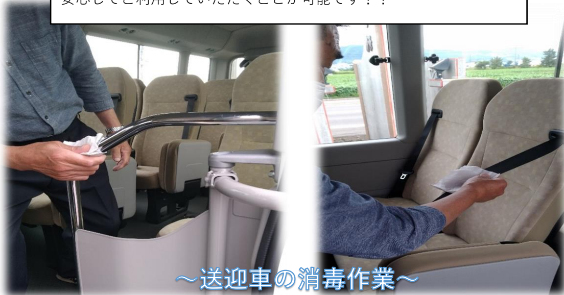
～送迎車の消毒作業～

お迎え時の検温と乗車前に手指消毒を行っており、施設到着後は各座席やシートベルト、手すり等の消毒作業を徹底していますので安心してご利用していただくことが可能です！！